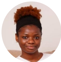
Frances Iyere Swyddog Cymorth Llywodraethu Gwybodaeth Iechyd a Gofal Digidol Cymru

Mae Ben hefyd yn helpu i gynnal gwefan WASPI ac yn darparu cymorth Llywodraethu Gwybodaeth cyffredinol i IGDC.